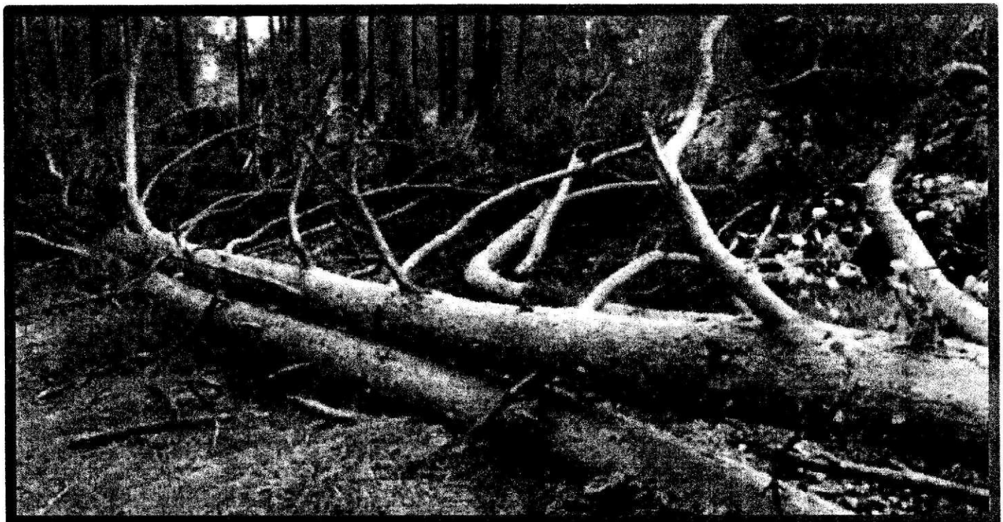
Изображение № 5 Лежащее на поверхности земли ветровальное дерево, не имеющее признаков отмирания. Не является валежником

Ветровальные деревья (вывернутые с корневищем) не являются мертвыми деревьями, хотя они лежат на земле, но могут продолжать жить, расти и даже давать потомство (вегетативное).