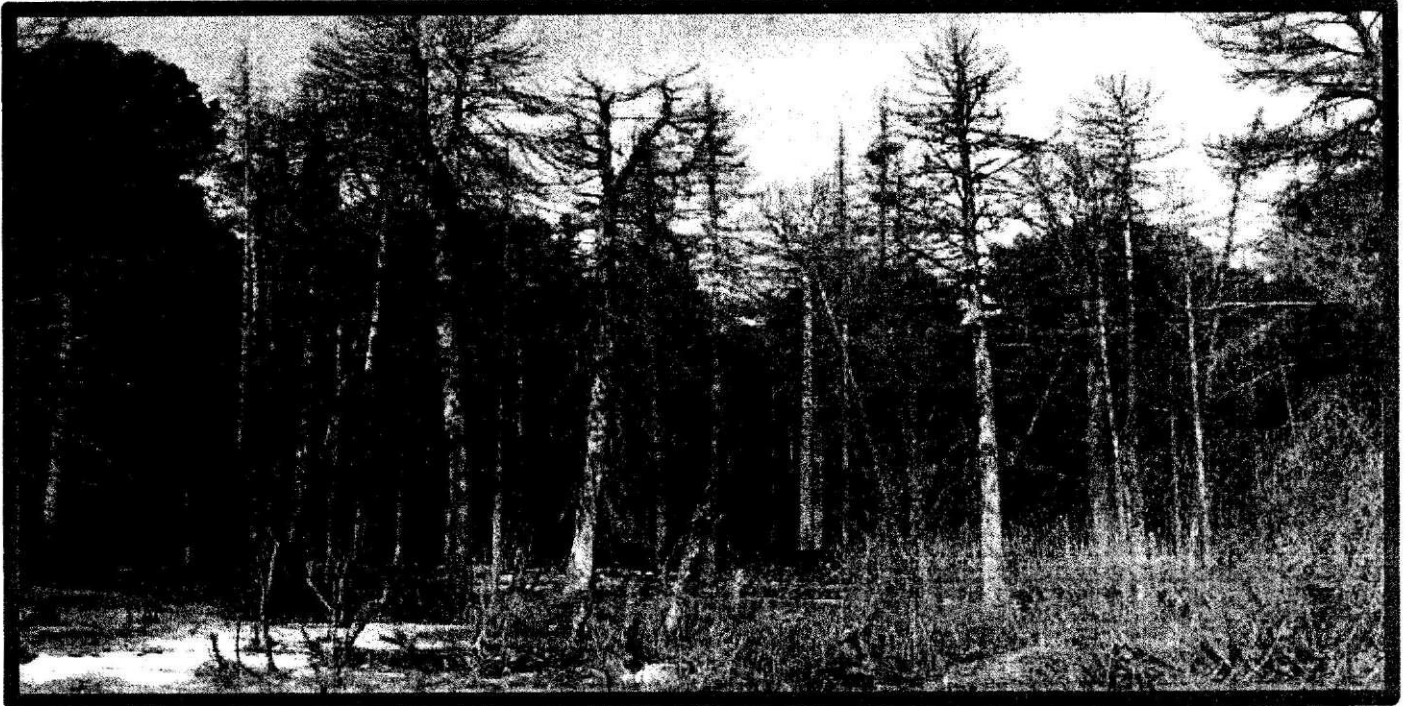
Изображение № 4 Сухостойное дерево. Не является валежником

Кроме того, необходимо обратить внимание, что деревья, которые лежат на земле, но не имеют признаков естественного отмирания (имеют зеленую листву или хвою), определять как «мертвые» не допускается ( смотри изображение № 5 ).